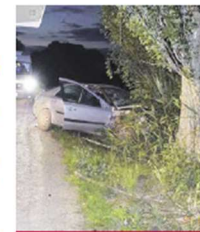
▲ Z miesta nehody.

Mladík utrpel viaceré vážne zranenia, ktorým na mieste podľahol. Presné príčiny a okolnosti nehody policajti vyšetrujú. Od začiatku roka eviduje polícia v Trnavskom kraji už 23 smrteľných dopravných nehôd, takmer polovicu z nich zavinila neprimeraná rýchlosť. Najviac tragédií sa v tomto roku stalo v okresoch Skalica, Trnava a Dunajská Streda na cestách II. triedy, väčšina z nich sa stala mimo obce. ▲ Peter Briška